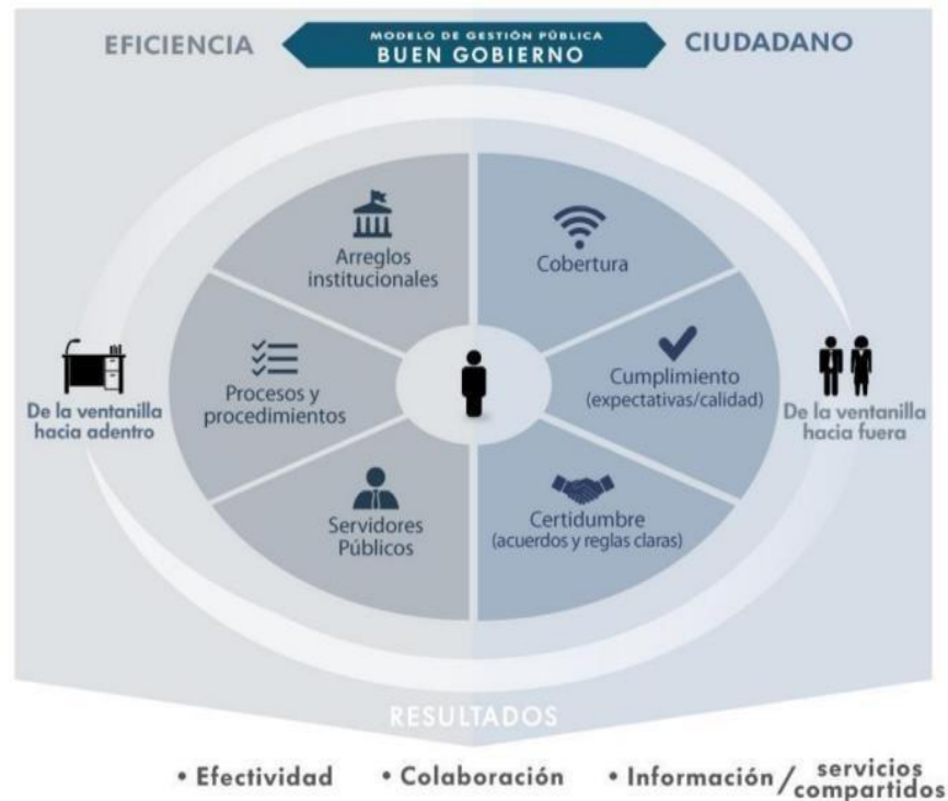
Gráfica 1. Modelo gestión pública al servicio del ciudadano

En este sentido, Función Pública con el fin de fortalecer las capacidades de los servidores públicos, de las entidades y organismos del Estado, para el desarrollo de la democratización de la gestión pública y el servicio al ciudadano, definió el modelo de servicio al ciudadano de la Entidad, teniendo en cuenta los lineamientos establecidos en la Política de Eficiencia Administrativa al Servicio del Ciudadano establecidos en el CONPES 3785.